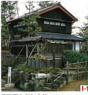
藤野嚴九郎紀念館 (敦原市) 陳列解剖學教授藤野先生和魯迅先生師生二人的有關資料。 ☎(0776)77-3331 事務局 ◎休息日 12月29日至1月3日