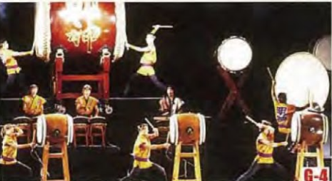
O・TA・I・KO響 (越前町) 日本大鼓的表演盛會。能夠欣賞動人心弦的演奏。 ◎舉辦日期 8月中旬