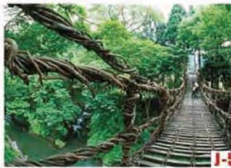
蔓草橋 (池田町) 蔓草橋是跨越足羽川溪谷的正式的木製吊橋，全長44米，在橋上感覺涼爽宜人。