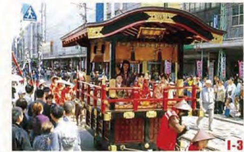
越前時代行列 (福井市) 每年4月上旬，身著戰國時代的英雄和武士裝的人們，踏著整齊的步伐浩浩蕩蕩地穿行於市內中心地區，再現勇武時代的壯觀風景。 ◎舉辦日期 4月中旬