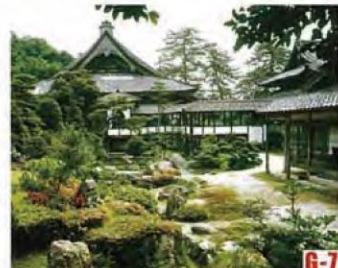
西福寺 (敦賀市) (紅葉景點一百選) 紅葉首屈一指，一年四季風景俱佳。被指定為國家級名勝。 ◎紅葉似火之時 10月下旬至11月中旬 ☎(0770)22-3926