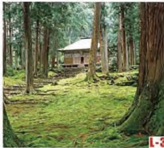
平泉寺白山神社 (勝山市) 修驗道三大聖地之一。參拜路被指定為“日本道路一百選”，因為杉樹和綠苔的幽香被指定為“香氣風景一百選”。 ☎(0779)88-1591