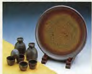
越前燒 越前燒是福井的名優產品，風格古樸，被認為是「日本六大古窯之一」。