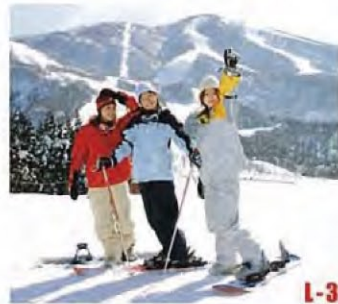
SKI JAM勝山 (勝山市) 設有西日本最大的滑雪場，MTB賽道等，是個一年四季都能享受的修養場所。 ☎(0779)87-6109