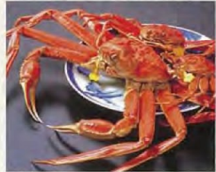
越前螃蟹 冬季時鮮極品。煮出來的螃蟹，格外美味。每年11月的捕蟹開禁期，都有眾多遊客蜂擁而至。