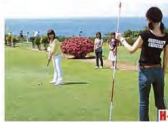
芝政世界 (坂井市) 這裡有世界最大的推桿高爾夫球場等娛樂設施，是大型的娛樂場所。 ☎(0776)81-2110