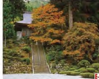
萬德寺 (小濱市) (紅葉景點一百選) 有國家指定為名勝的庭園，春季的杜鵑和秋季的紅葉最值得一看。 ◎紅葉似火之時 11月中旬至11月下旬 ☎(0770)56-2308