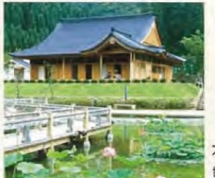
花蓮公園 (南越前町) 世界各地的花蓮爭妍鬥豔的南條花蓮公園。7月上旬至8月上旬蓮花節期間，夜晚燈火通明。 ☎(0778)47-8002