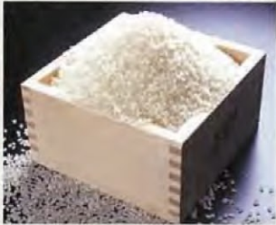
越光大米 美味大米的代名詞——越光大米，最早產於福井。