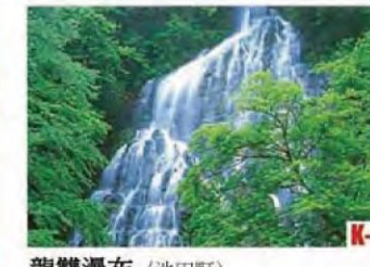
龍雙瀑布 (池田町) 大約有60米的落差。是「日本100選瀑布」其中的壹個。附近是綠意重重，美麗的山谷，特別是從下邊仰望瀑布的雄姿，只能用壯觀這句詞來形容。