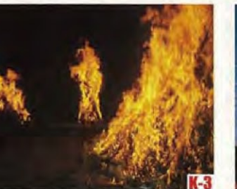
勝山左義長節 (勝山市) 自從平安時代流傳的活動之一，在元宵節那天舉行的奇特鎮火活動。 ◎舉辦日期 2月最後的周六、周日