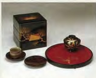
越前漆器 據傳越前漆器起源於遙遠的6世紀左右，其造型優雅，工藝精美，得到好評。