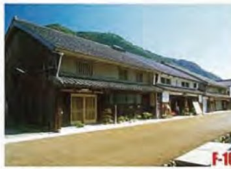
熊川宿 (若狹町) 始於江戶時代的重要驛站鎮。被指定為國家級重點保護傳統建築物群。 ☎(0770)62-0330 ◎“驛站館”休息日 每週一