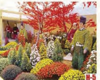
武生菊偶人 (越前市) 是秋季北陸特有的景物。菊花開得五彩繽紛。 ◎舉辦期間 10月至11月