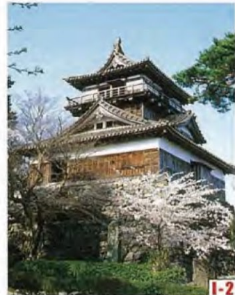
丸岡城 (坂井市) 日本最古老的太守瞭望樓，櫻花盛開時會看到海市蜃樓那樣夢幻般的景色。是國家指定建築物。 ☎(0776)66-0303