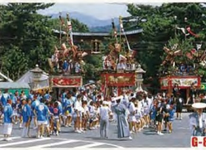
敦賀節 (敦賀市) 自從室町時代流傳下來的節日遊行彩車，別具特色的活動中心廣場及狂歡節遊行等，鎮上充滿著節日的歡樂氣氛。 ◎舉辦時期 9月上旬