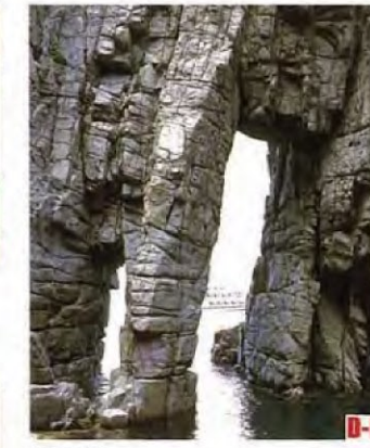
蘇洞門 (小濱市) 波濤洶湧形成的礁石，洞窟千奇百態，景色極為壯麗。