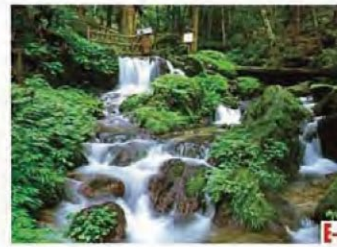
瓜割瀑布 (若狹町) 自古作為神泉受到尊崇，“名水一百選”。這一帶是若狹瓜割名水公園。 ☎(0770)62-0186