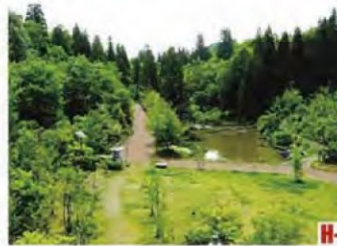
福井綜合植物園 (越前町) 這裡有從日本乃至世界各地收集的3,000多種植物，是日本海側最大規模的植物園。 ☎(0778)34-1120 ◎休息日 每週二