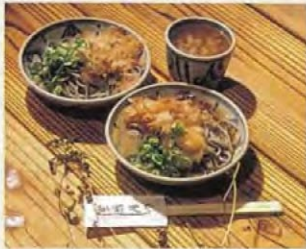
越前蘿卜泥蕎麥麵 品嘗在剛拌出來的蕎麥麵上倒上有蘿卜泥的獨特湯汁的一品。