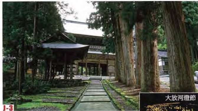
永平寺 (永平寺町) 約760年前由道元禪師創建的出家參禪的道場。 ☎(0776)63-3102