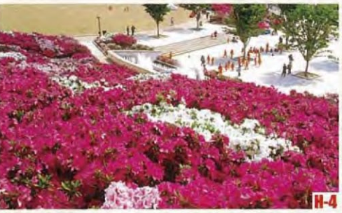
西山公園 (鯖江市) 約4萬6千棵杜鵑花爭妍鬥豔，是日本海側屈指可數的杜鵑花的景觀。站在瞭望台上，可以眺望觀賞遠方的白山連峰。 ◎杜鵑花盛開之時 4月下旬至5月上旬 ☎(0778)51-1001