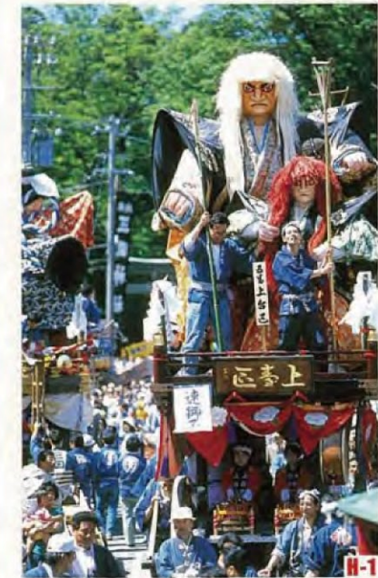
三國節 (坂井市) 載著高大武士偶人的彩車在街上行進的三國節是北陸三大節之一。 ◎舉辦日期 5月19日至5月21日