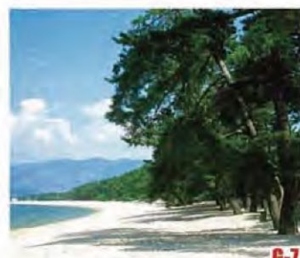
氣比松原 (敦賀市) 與虹松原(佐賀縣唐津市)、美保松原(靜岡縣靜岡市)並列為日本三大松原之一。藍天、白砂和青松相繼而成的美麗景觀是大自然的傑作。國家級名勝。