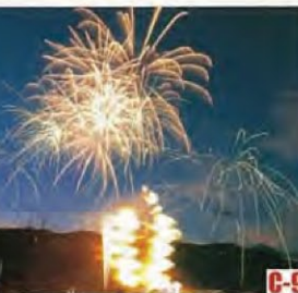
若狹大飯鎮火節 (大飯町) 火把遊行，大火勢的火焰呈現樹狀形。充滿幻想的仲夏夜活動。 ◎舉辦日期 8月上旬