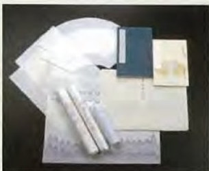
越前和紙 越前和紙具有1500年的歷史，以最高品質的和紙而著稱。