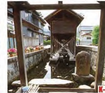
御清水 (大野市) 作為富有風味的水受到青睞，被指定為“名水一百選”。