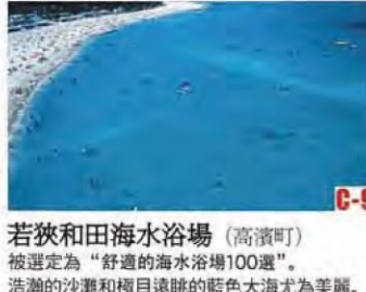
若狹和田海水浴場 (高濱町) 被選定為“舒適的海水浴場100選”。浩瀚的沙灘和極目遠眺的藍色大海尤為美麗。