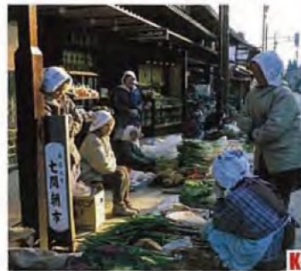
七間早市 (大野市) 這裡的早市400年前就開始了，一直是老百姓的膳食中心。 ◎舉辦期間 春分至12月31日