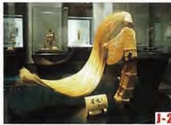
越前竹偶人之鄉 (坂井市) 陳列出不少以歌舞伎等為題材而製成的竹偶人和竹工藝品。 ☎(0776)66-5668 ◎休息日 12月26日至31日