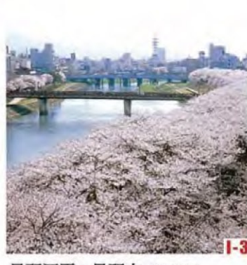
足羽河原・足羽山 (福井市) 櫻花樹並列綿延2.2公里，被確定為“櫻花名勝一百選”。 ◎櫻花盛開之時 4月上旬